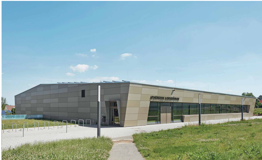
Außenansicht 3-feldrige Sporthalle am Lauerbäumle